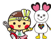
とちまるくん・ナイチュウ ▲大会マスコットキャラクター